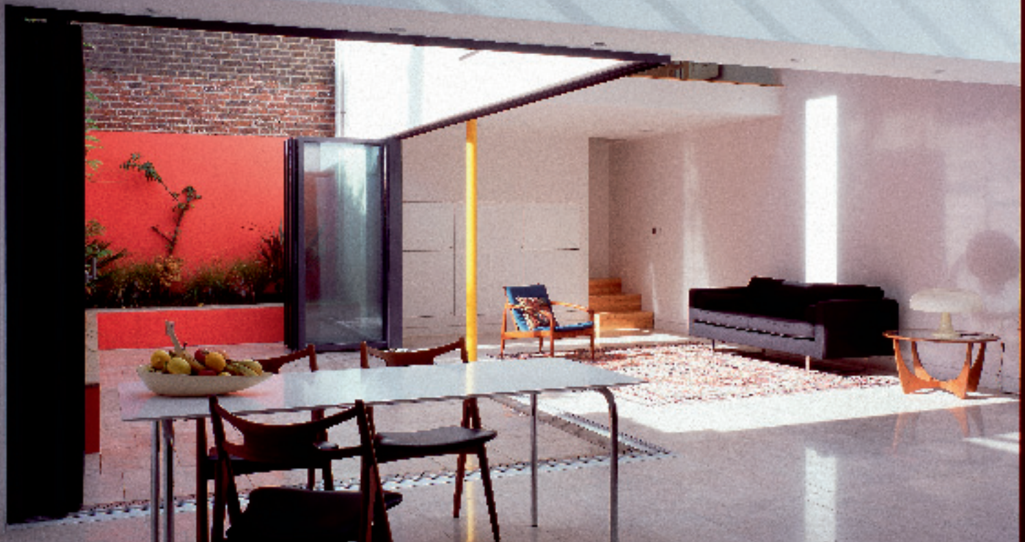
LYST OG LÆKKERT: Det er ikke til at se, at det er en baggård i et tæt bebygget kvarter. Baggårdens terrasse virker som en naturlig forlængelse og lyskilde til stueetagen.